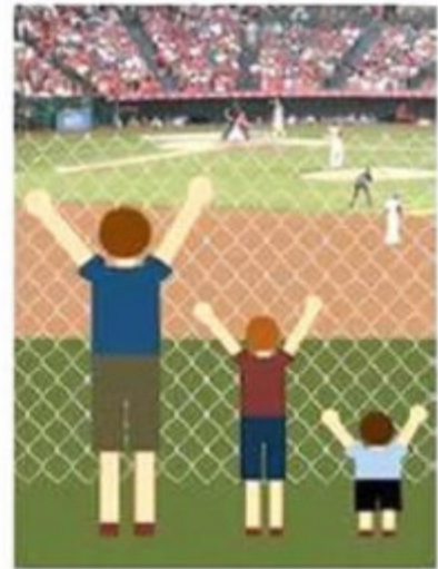
'Nieuwe oplossing: algemeen toegankelijk voor iedereen!'