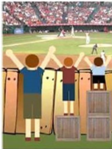
'Iedereen zo behandelen dat de mogelijkheden gelijk zijn'