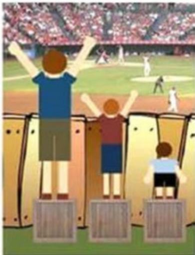
'Iedereen gelijk behandelen'

Landen die het VN-verdrag hebben geratificeerd, hoeven niet alles in één keer op orde te hebben. Zij moeten aan een internationaal mensenrechtencomité laten zien welke stappen ze zetten. Dit comité beoordeelt of de voortgang voldoende is. De maatregelen moeten bovendien redelijk zijn. Dat betekent dat zij niet mogen leiden tot onevenredige of onnodige overlast voor anderen. Kijken hoe we met elkaar drempels in de samenleving kunnen wegnemen is meestal een goed begin. Vaak kan dat al met hele kleine aanpassingen. Als je samen op zoek gaat naar die oplossing, dan kom je er meestal wel uit.